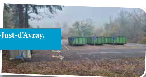
Déchetterie Saint-Just-d'Avray, route de Grandris