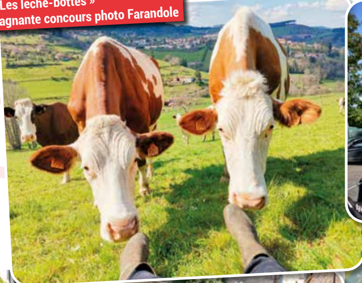
« Les lèche-bottes » Gagnante concours photo Farandole