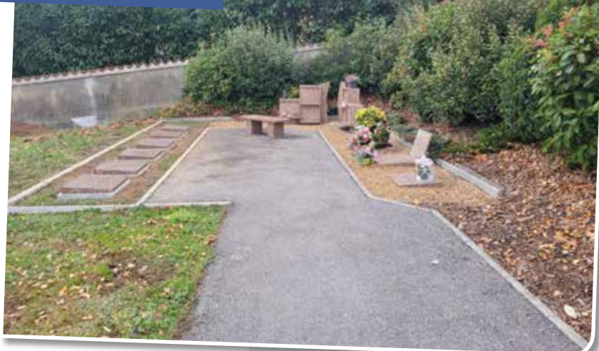
Extension du columbarium