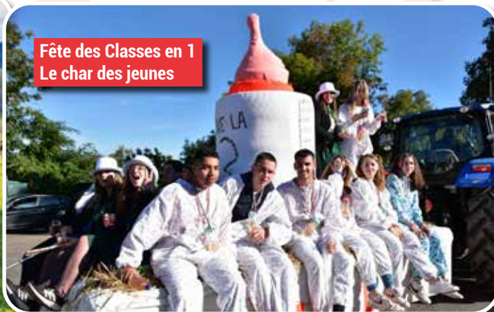
Fête des Classes en 1 Le char des jeunes