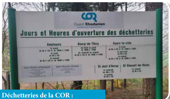
Déchetteries de la COR : Accès avec justificatif de domicile