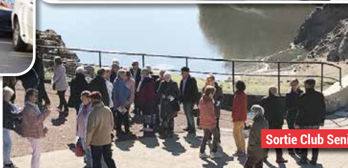
Sortie Club Senior