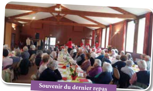
Souvenir du dernier repas

Cette année 2021, ne nous a permis d'organiser que quelques rendez-vous, en particulier une visite à chaque personne bénéficiant de notre association, la vente des fleurs pour la fête des classes.